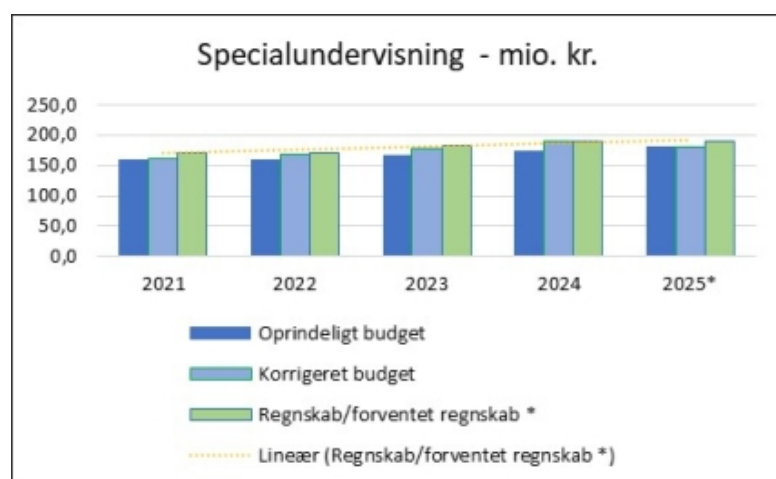
Graf 1: Oprindeligt og korrigeret budget for 2021-2025 samt regnskaber for 2021–2024 og forventet regnskab for 2025

I samme periode er antallet af helårspersoner i specialundervisning steget fra 415,0 til forventet 476,2 svarende til en stigning på ca. 61 helårspersoner eller godt 15 %. Specifikation på de enkelte kategorier vises i tabellen nedenfor, hvoraf det fremgår, at stigningen især ligger på egne skoletilbud.