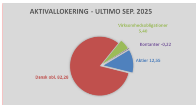
Figur 2: Aktivallokering ultimo 3. kvartal 2025

Det er vigtigt at understrege, at kontanterne på intet tidspunkt har haft en negativ saldo.