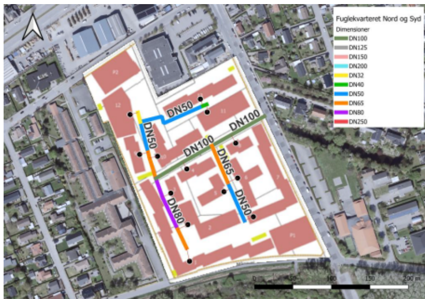
Figur 2: Den planlagte ledningsføring for det nye boligområde ved Tårnfalkevej.

Varmen leveres af VEKS (Vestegnens Kraftvarmeselskab), som allerede har infrastruktur og varmekapacitet til den øgede varmelevering.