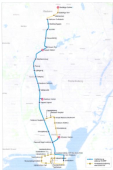
Figur 10. Forslag til nye buslinjer og eksisterende buslinjer i Hvidovre kommune.