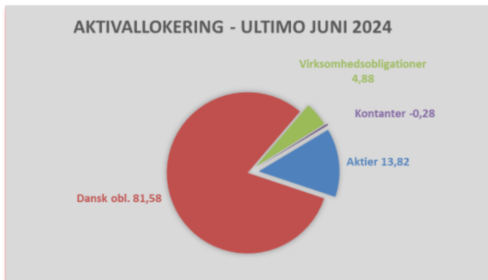
Figur 2: Aktivallokering ultimo 2. kvartal 2024

Status på portefølje gældplejerapportering (passivside)