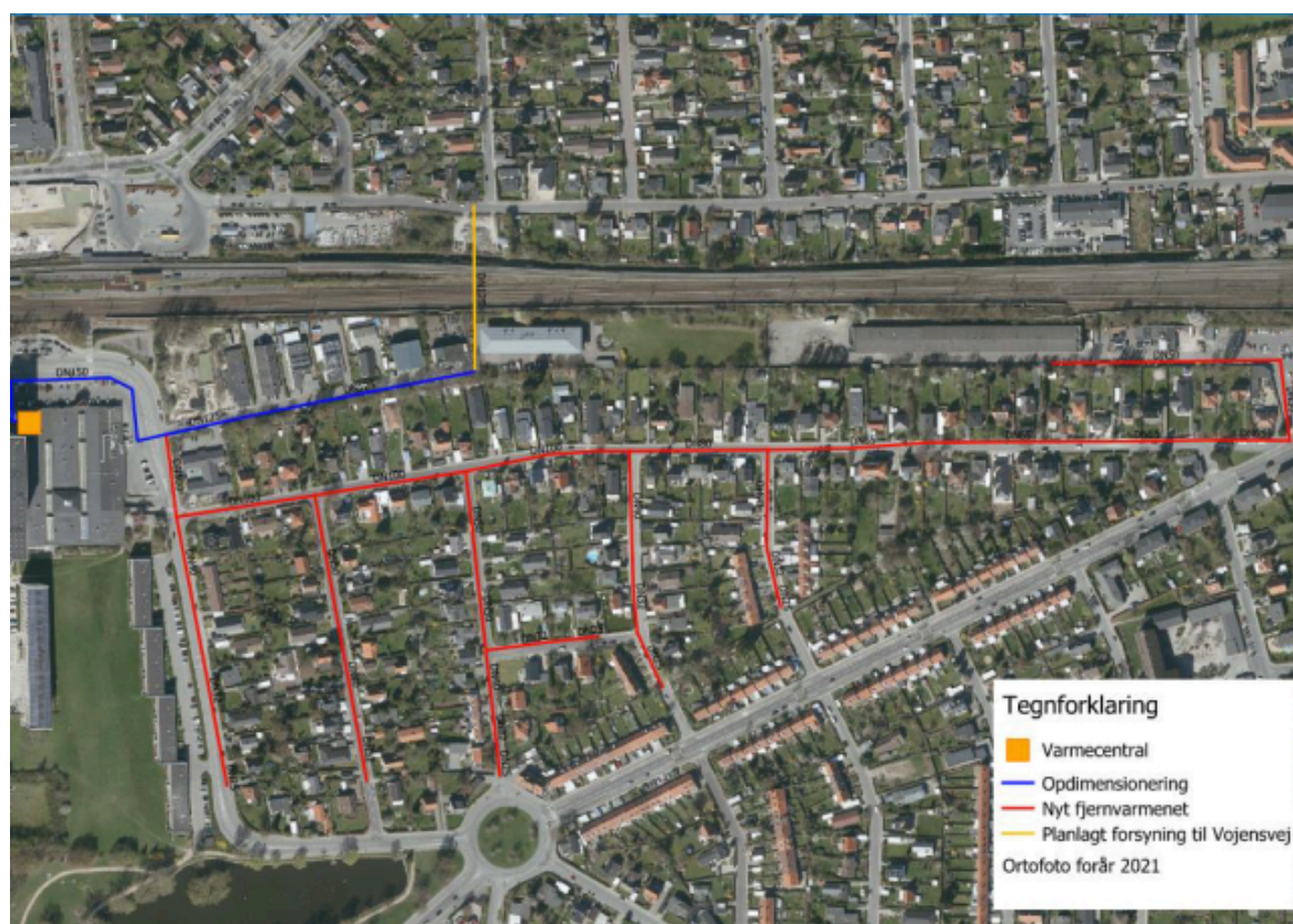
Figur 1 Oversigt over det planlagte forsyningsnet i Rebæk Nord

Etablering af varmeproduktionsanlæg og fjernvarmeledninger forventes påbegyndt primo/medio 2022 med forventet varmelevering til de første kunder i løbet af sommer/efterår 2022.