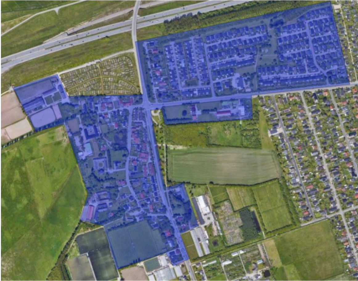
Figur 1. Forsyningsområde for fjernvarme.

Dette fjernvarmeprojekt er et ø-projekt, som skal vise, at også i ældre landsbyer med forskellige hustyper vil det være muligt at etablere en kollektiv energiforsyning, der trods sin kollektivitet tager udgangspunkt i de forskellige hustypers energimæssige tilstand. EBO Consult A/S har på vegne af Hvidovre Fjernvarmeselskab A.m.b.a. udarbejdet dette projekt og har fået midler fra EU og Energistyrelsen til at gennemføre projektet, der har generel interesse for landets fjernvarmeselskaber og kommuner, ligesom det vil være en showcase i EU.