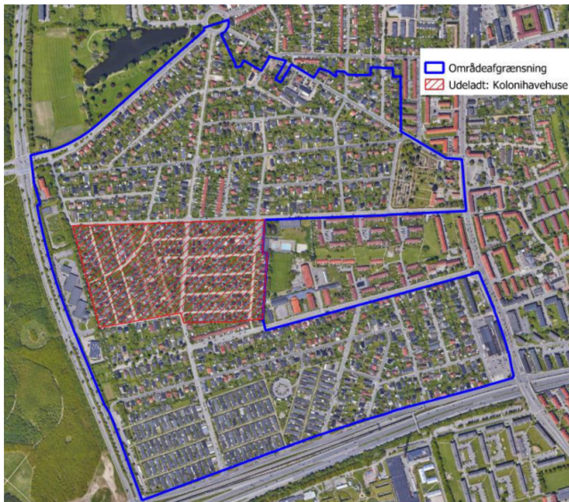
Figur 1. Forsyningsområde for fjernvarme.

Hvidovre Fjernvarmeselskab har fremsendt projektforslaget vedlagt som bilaget ”Projektforslag Rebæk Syd og Præstemosen – revideret”. Projektet omlægger varmforsyningen i området fra naturgasfyr til fjernvarme. Figur 1 illustrerer forsyningsområdet.