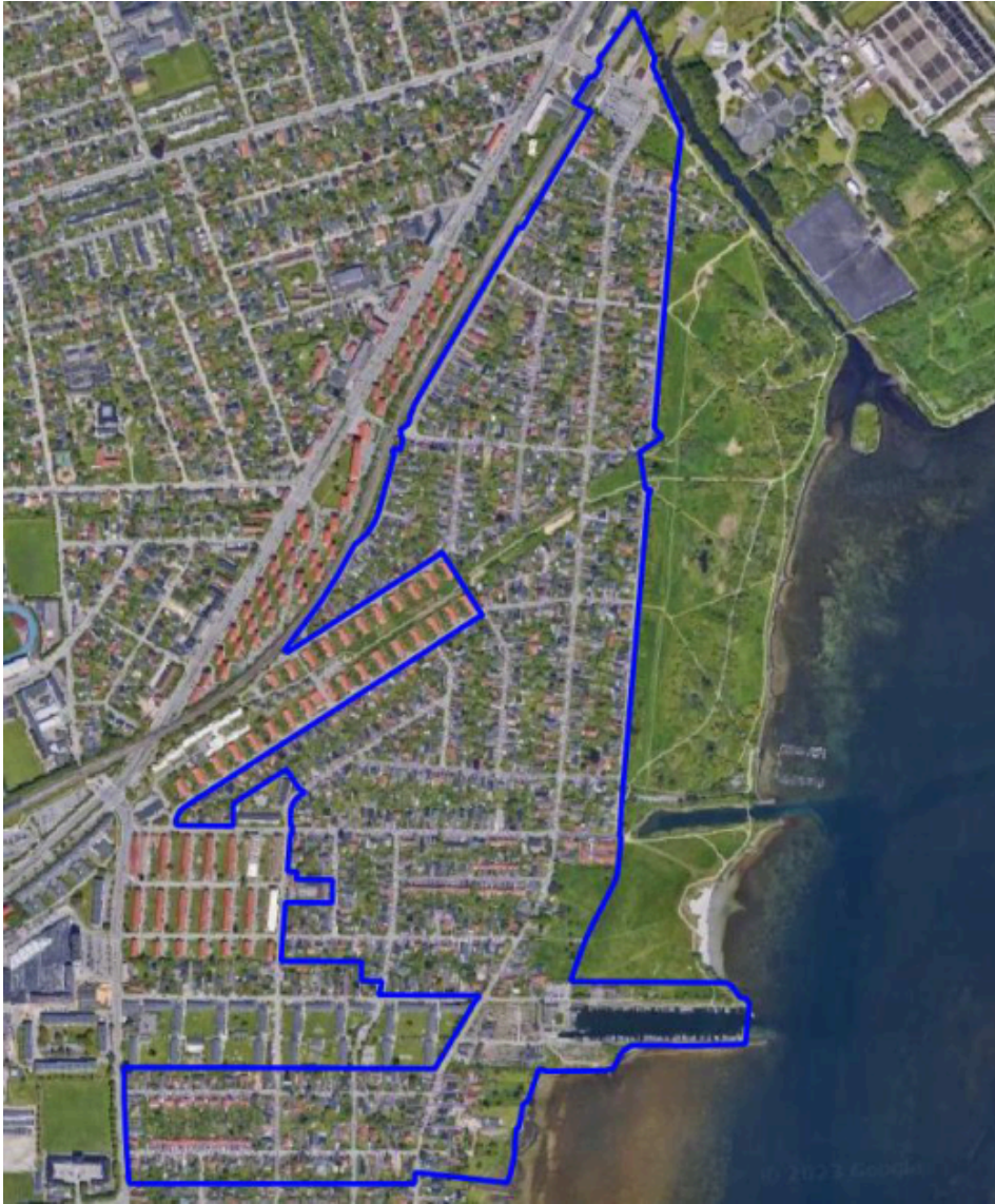
Figur 1. Forsyningsområde for fjernvarme.

Varmen til Hvidovre Fjernvarmeselskabs fjernvarmeledninger leveres af VEKS – Vestegnens Kraftvarmeselskab, som allerede har infrastruktur og varmekapacitet til den øgede varmelevering. Fjernvarmenettet tilsluttes vekslerstationen på Dansborgskolen. Der skal derfor ikke etableres anlæg til produktion af varme og heller ikke findes arealer til det i området.