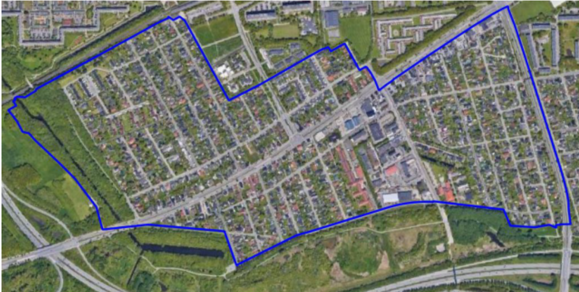
Figur 1. Forsyningsområde for fjernvarme.

Varmen til Hvidovre Fjernvarmeselskabs fjernvarmeledninger leveres af VEKS – Vestegnens Kraftvarmeselskab, som vil ombygge en bygning kaldet ”Hvidovre Syd” for enden af Tårnfalkevej til vekslersstation. VEKS står for ombygning og er derfor ikke vurderet yderligere i dette projektforslag.