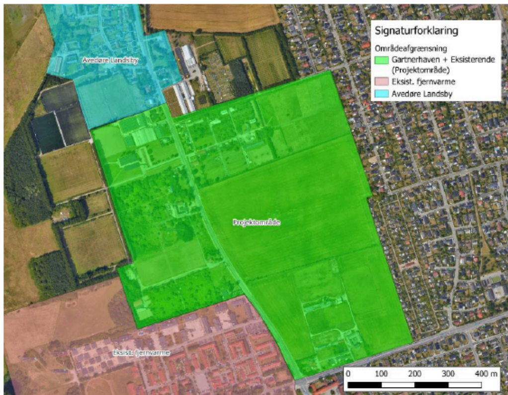
Figur 1 Oversigtsplan for forsyningsområdet.

For at etablere fjernvarme skal der nedgraves rør. I projektforslaget vedlagt som bilag - ”Fjernvarmeforsyning af Gartnerhaven_v2.0” viser Figur 5-2 (side 16) hovedledningen fra Avedøre Stationsby (det blå område), der føres op langs Byvej, samt stikledningerne ind til de eksisterende ejendomme langs Byvej.