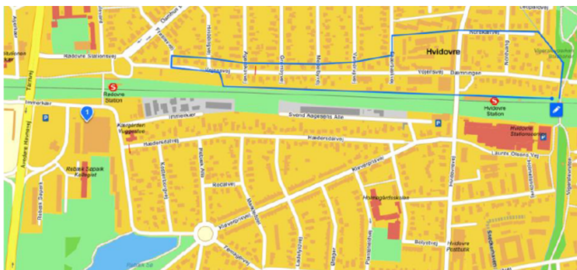
Figur 1 Oversigt over forsyningsområdet ved Vojensvej